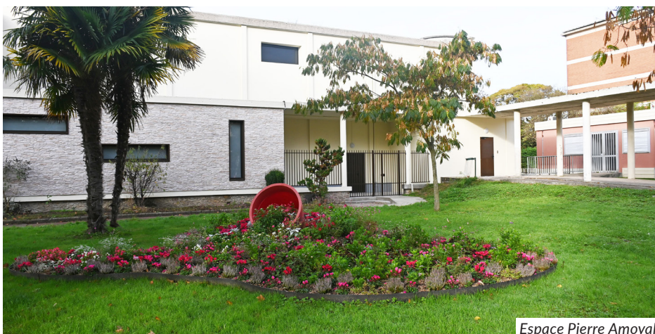
Espace Pierre Amoyal

En 2025, à la demande de la ville, l'établissement public a entrepris d'importants travaux afin d'améliorer les conditions d'accueil des artistes. 3 loges spacieuses, équipées de douches et de sanitaires, dont une accessible aux personnes à mobilité réduite, ont remplacé les préfabriqués. Reliées à la salle de spectacle par un couloir, elles permettent aux artistes de circuler facilement et d'entrer par le fond de scène, côté cour.