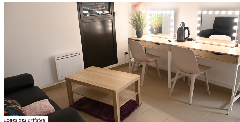
Loges des artistes