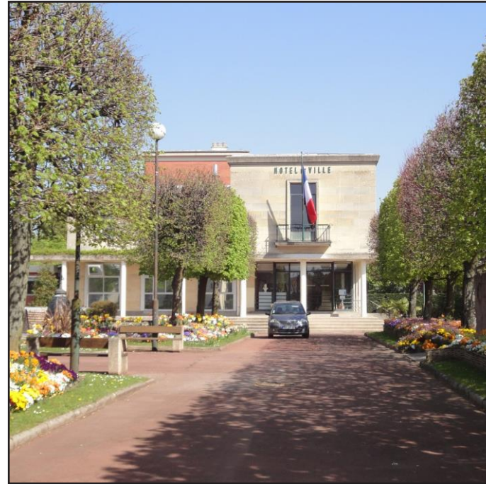
5 - Annexes

Approuvé en Conseil Territorial le : 8 octobre 2019